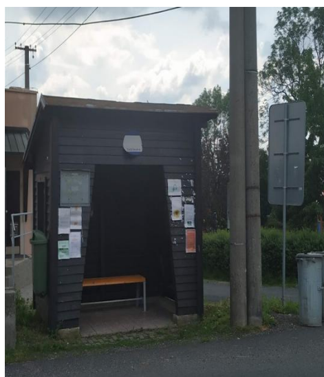
Zastávka směr Chodov